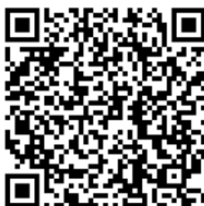
Рисунок 4 — Сценарий для проведения дебатов «Идеология радикализма»

Первая команда всегда будет представлять сторону радикальной идеологии. Задача команды студентов – найти контраргументы тех радикальных и спорных тезисов, которые будет озвучивать первая команда. Тем самым, участники будут вынуждены критически рассматривать постулаты радикальных идеологий, искать в них логические ошибки, несоответствия – самостоятельно приходить к выводу о деструктивности любой радикальной идеологии (см. рисунок 4).