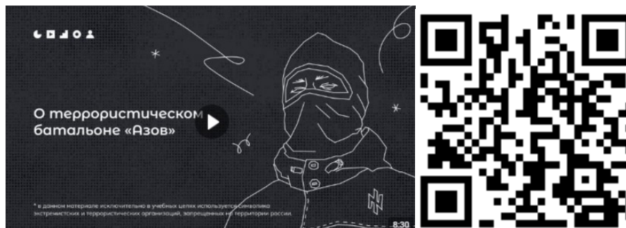
Рисунок 2 – Видеоролик, разъясняющий причины признания организации террористической

3) батальон «Азов» (см. рисунок 2) — военизированное подразделение, созданное в 2014 году на базе футбольных ультрас и праворадикалов Харькова и некоторых других украинских регионов. «Азовцы» причастны к массовым военным преступлениям против мирного населения Донбасса и Украины. Сама организация признана террористической в России по решению Верховного Суда Российской Федерации от 02.08.2022 г. № АКПИ22-411С. Батальон «Азов» входит в состав Национальной гвардии, подчиненной Министерству внутренних дел Украины. С 2014 года боевики батальона «Азов» систематически пытали, убивали и грабили мирных жителей ДНР, ЛНР и востока Украины. У батальона неонацистская идеология. Это проявляется в расизме, русофобии, восхвалении наследия Третьего рейха и украинских коллаборационистов в годы Второй мировой войны. Среди боевиков в том числе распространены радикальные неоязыческие взгляды. Свою идеологию боевики активно распространяют среди украинской молодежи через лагеря подготовки, печатную продукцию (комиксы, книги) и интернет-сообщества. С «Азовом» активно сотрудничает большое количество праворадикальных течений на Украине (признанных в России экстремистскими организациями), например, «Правый сектор», «УНА-УНСО», организация «Тризуб им. Степана Бандеры» и т.д.